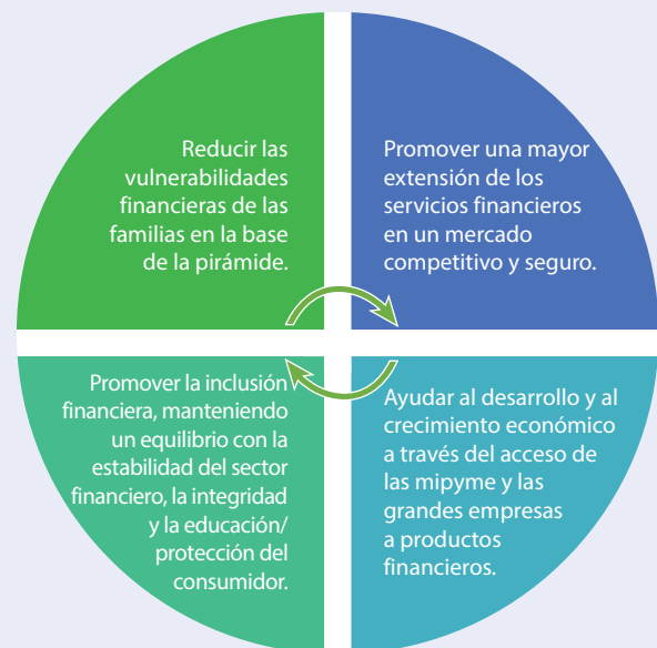
FIGURA 2. Objetivos de la ENIF

Nota: mipyme = Micro, pequeñas y medianas empresas.